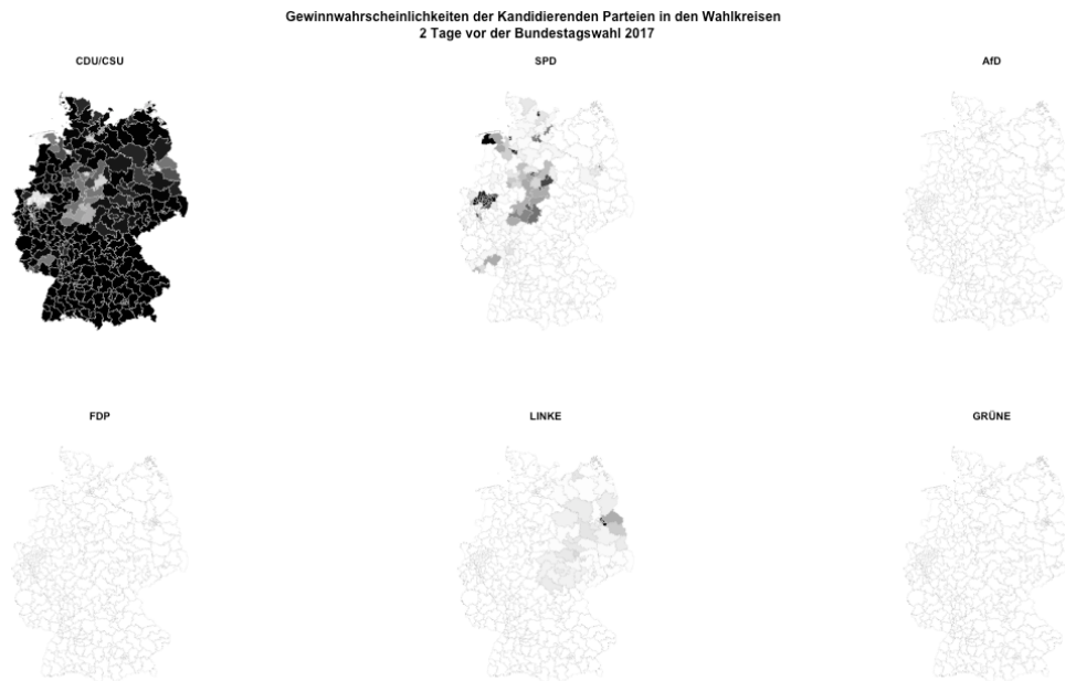
Abbildung 2: Gewinnwahrscheinlichkeiten der Kandidierenden zwei Tage vor der Bundestagswahl 2017